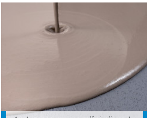
Aanbrengen van een zelf-nivellerend egalisatiemiddel op een droge laag Eco Prim Grip Plus op een bestaande vloer