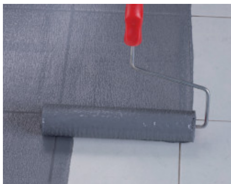
Met een roller aanbrengen van Eco Prim Grip Plus op bestaande porseleinen tegels